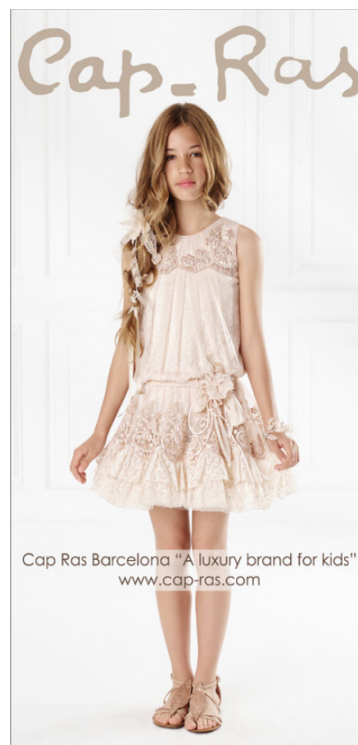
Anzeigenbeispiel 1/1 S. 4c