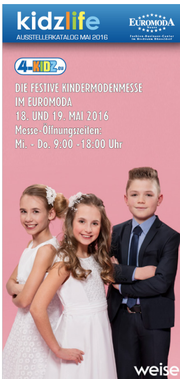
Anzeigenbeispiel Titel 4c